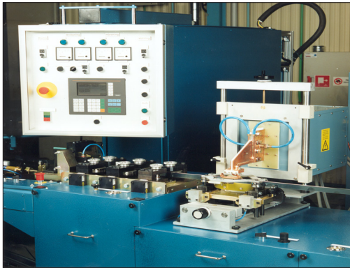
操作员面板及淬火组件