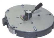
ALO 90909 自动锁定锯条的可扩展 中心盘