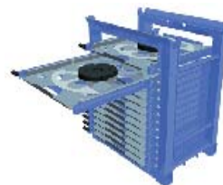
ALO 103 CUBE 卷材处理系统