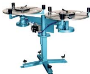
ALO 822 双轴卷材机